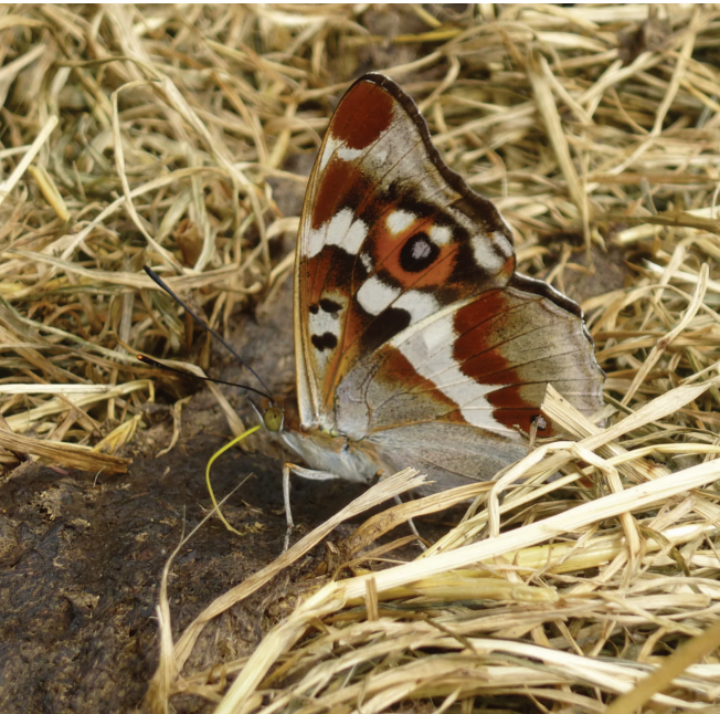
Grote weerschijnvlinder fouragerend op drijfmest nabij de Kruiskapel in Eksaarde begin juni 2018.

Het is ondertussen van de zomer van 2012 geleden dat in onze regio de eerste niet-gedocumenteerde waarneming is gedaan van de grote weerschijnvlinder ( Apatura Iris ) in Berlare in de omgeving van de Maai-donkbossen. Een jaar later kon deze waarneming fotografisch bevestigd worden. Het enthousiasme was groot en de weken daarop werd de soort meermaals gespot in Berlare waaronder af en toe twee vechtende mannetjes. Er werden zelfs activiteiten georganiseerd om rupsen te zoeken op de waardplant boswilg, maar deze pogingen bleken negatief. Voortplanting in de regio kan tot op heden niet bewezen worden. Her en der werd er zelfs gefluisterd dat het om gekweekte uitgezette exemplaren zou kunnen gaan.