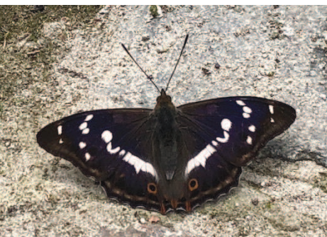
Mannetje grote weerschijnvlinder begin juni 2018 in Eksaarde.